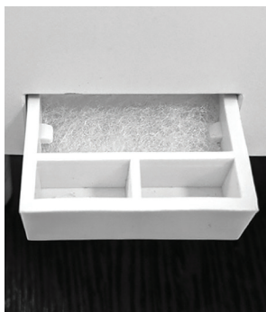
Ванночка для эфирных масел